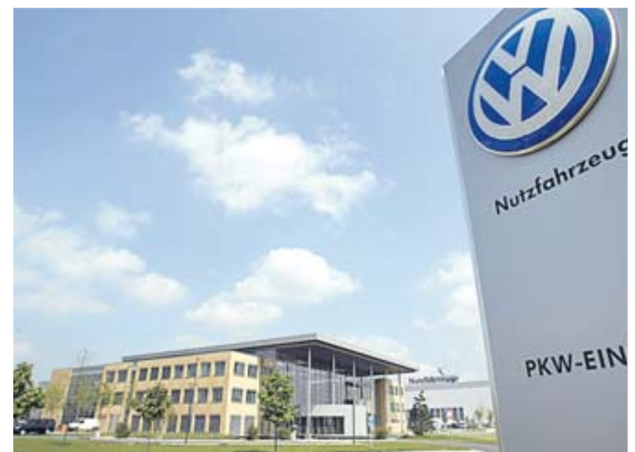
Im Juni 2000 eröffnet: Das neue Kundencenter in Stöcken.

Die erste Zeichnung von 1947 zeigt schon die charakteristische Form des späteren Bullis (links). Als Modell „Samba“ wurde er ab 1956 in Stöcken gebaut (oben). Der aktuelle T5 beinhaltet 50 Jahre Technikfortschritt.