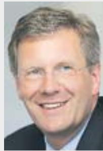
C. Wulff Christian Wulff Niedersächsischer Ministerpräsident

Zum 50-jährigen Jubiläum des VW-Werks Hannover spreche ich Vorstand, Mitarbeiterinnen und Mitarbeitern meinen sehr herzlichen Glückwunsch aus. Ich verbinde diesen Wunsch mit der Erwartung, dass die Erfolgsstory von Volkswagen Nutzfahrzeuge am Standort Hannover so eindrucksvoll wie in der Vergangenheit auch in der Zukunft fortgeführt wird.